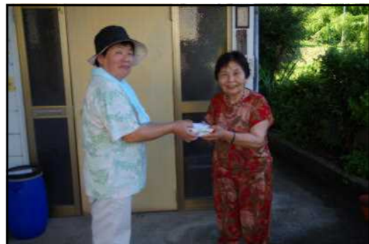
(写真は、小房地区の見守り訪問)

「お元気でお過ごしですか、お変わりはありませんか？」訪問された皆さんに、生活の困りごと等があれば、ご相談ください。